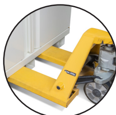
Déplacement par transpalette (à vide)

▲ 795+LI + 5 x E35LI + B35 + VIG100 + 4 PRISELI + PACABLI