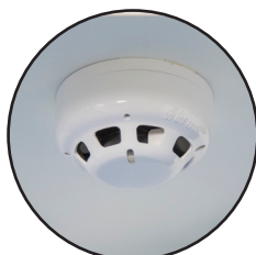
Détecteur de fumée (VIG100)