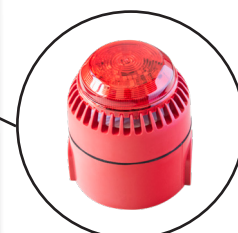
Alarme sonore et visuelle (VIG100)