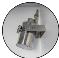
◀ Extincteur automatique à ampoule 79°C (EX100LI)