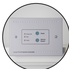
Boîtier d'alarme visuelle et sonore (VIG100)